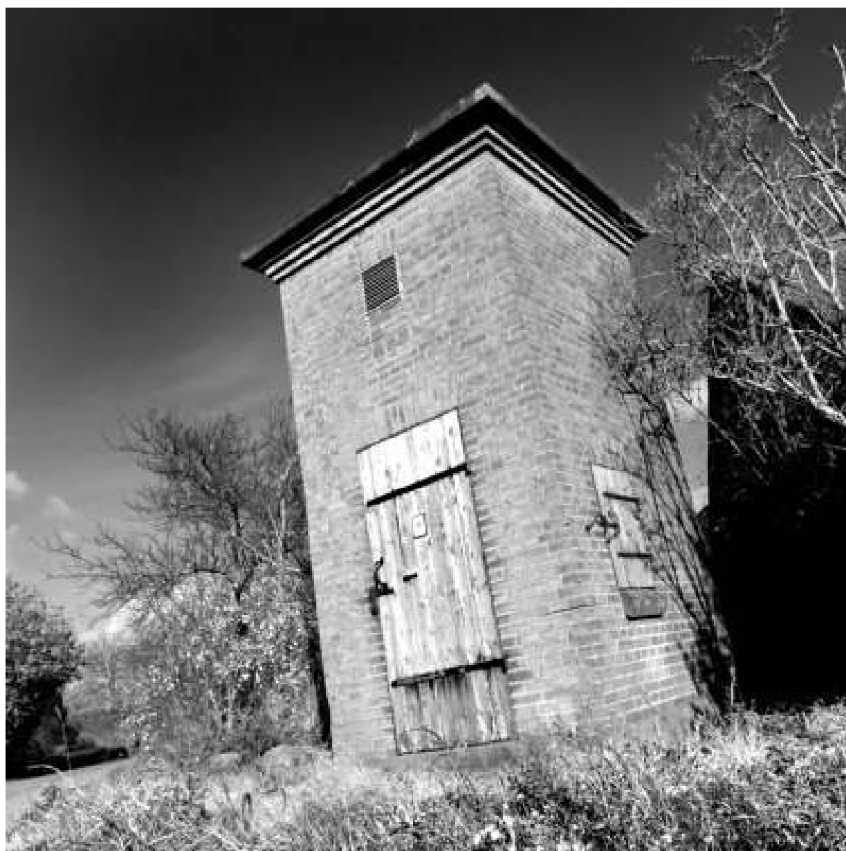
LM Foto v. Lars Moegreen