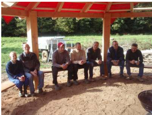
Byggeholdet der tømrede huset op på 14 dage.

Byggeprocessen har været et kapitel for sig. 2 uger før start begynder jeg at kalde folk sammen der har meldt sig som hjælpere, og er helt ærligt spændt på om det hele vil fungere. Bekymringerne er dog gjort fuldstændig til skamme, for ønsket og viljen til at bære projektet i mål har været overvældende. Der er støttet med arbejdskraft, materialer og maskintimer i en grad jeg ikke havde troet mulig. Jeg vil ikke her nævne alle, for det er mange, men blot sige at det har været utroligt inspirerende og opløftende at være tovholder undervejs.