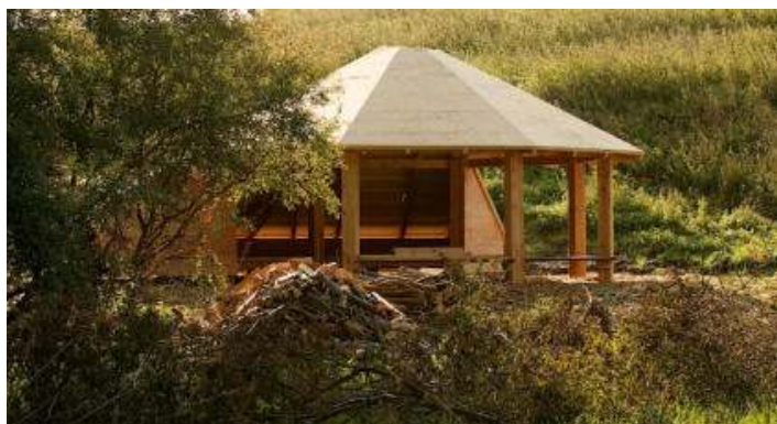
Resultatet af anstrengelserne

Med det engagement der er lagt indtil nu skal vi nok alle få glæde af stedet og hjælpes ad med ad passe og vedligeholde det fremover.