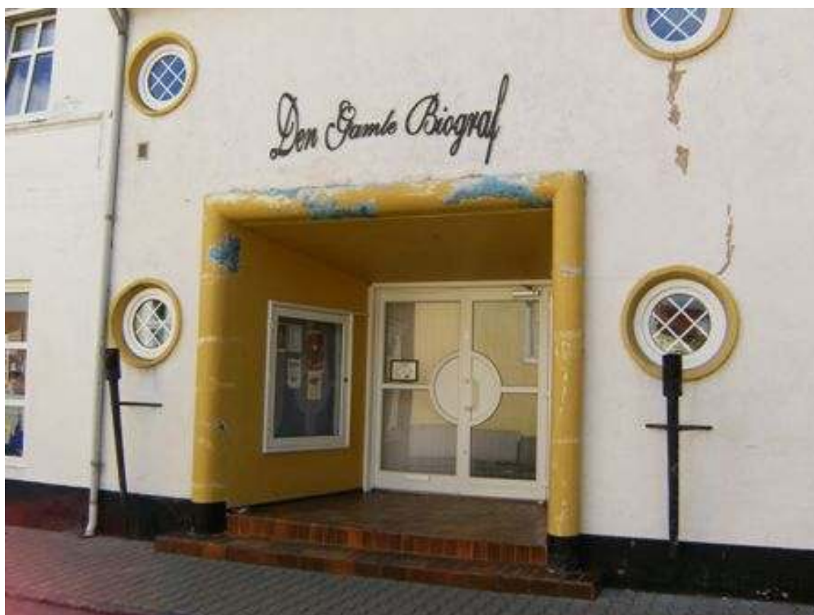
Feriefoto fra Løgumkloster