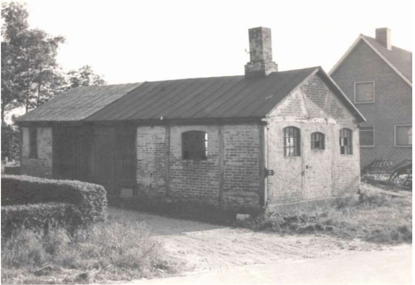
Hyldborgs Smedje, ca. 1960