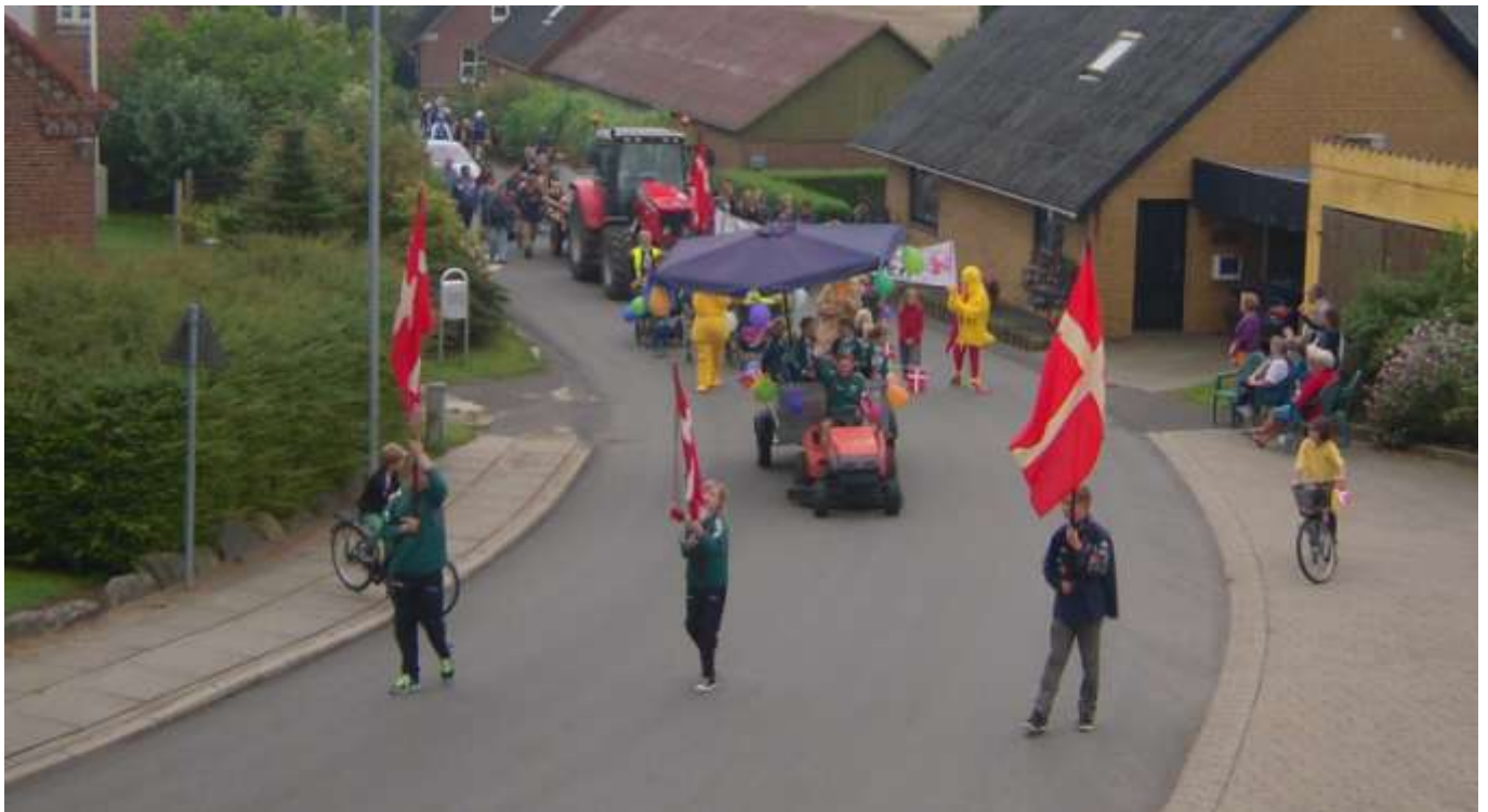
Optog fra byfesten.